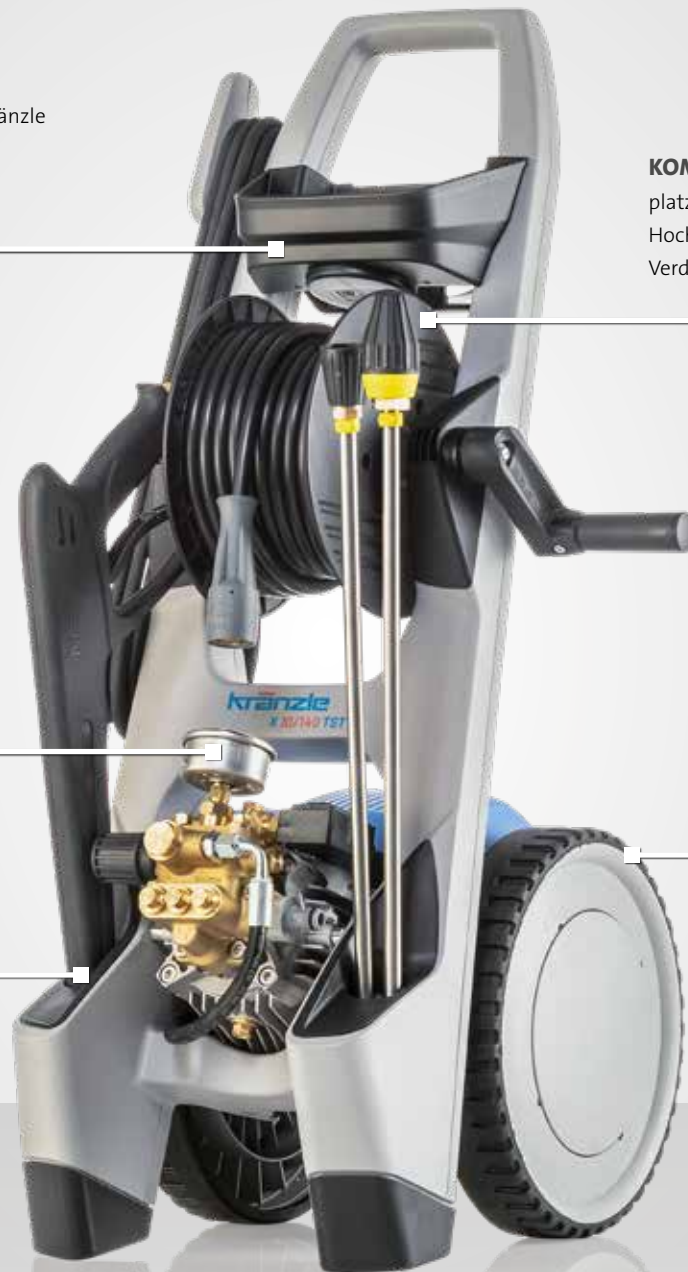
Abb.: X 10/140 TST | 603610

praktische Halterungen für Hochdruckpistole und Reinigungslanzen