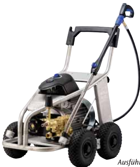
Ausführung mit Edelstahlrahmen