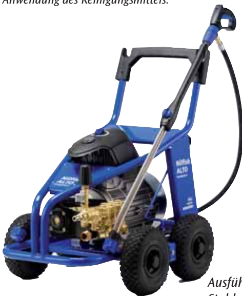
Ausführung mit Stahlrahmen

Das optimale Reinigungsergebnis erzielen Sie mit dem Einsatz von auf die Hochdruckreiniger abgestimmten Nilfisk-ALTO Reinigungsmitteln. Der Reinigungsmittelinjektor (optional) mit Ansaugschlauch ermöglicht eine schnelle und unkomplizierte Anwendung des Reinigungsmittels.