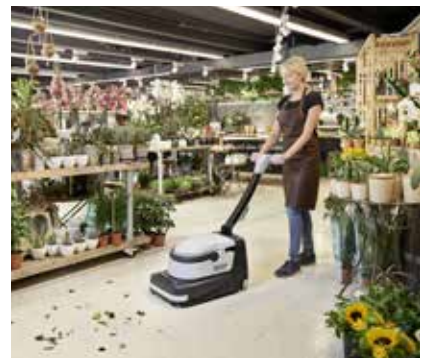
Böden leicht und schnell reinigen – gleichzeitig kehren, scheuern und saugen.