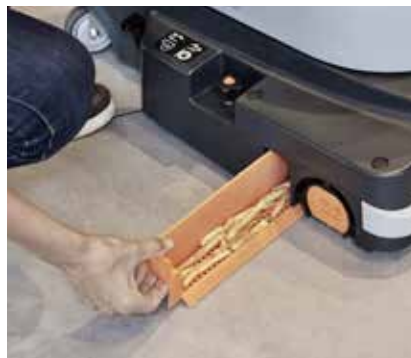
Der Grobschmutzeinsatz ist zum Leeren und Reinigen gut zugänglich