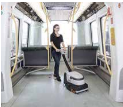
Leicht zu manövrieren dank Lenkrollen und ergonomischem, verstellbarem Schubbügel.