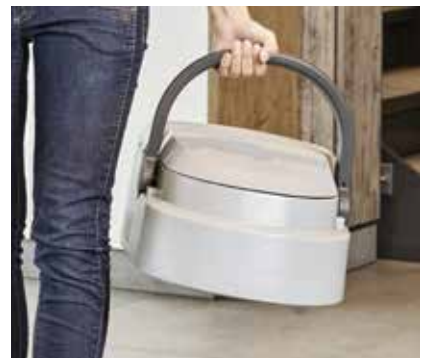
Das Tank-in-Tank-System vereinfacht die Handhabung beim Leeren und Nachfüllen