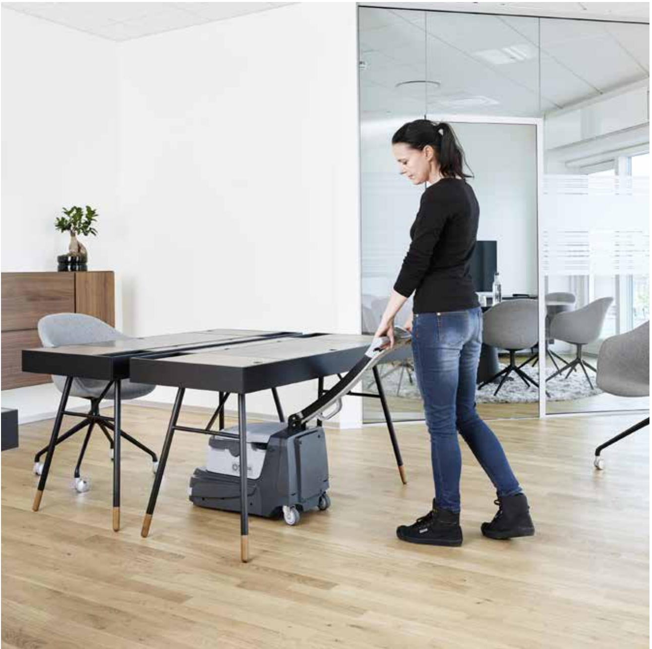
Der verstellbare Schubbügel kann beim Reinigen größerer Bereiche arretiert und beim Reinigen unter Möbeln und Regalen entriegelt werden.