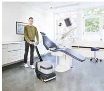
Gründliche Reinigung, die die Hygienestandards von Kliniken und Krankenhäusern erfüllt.