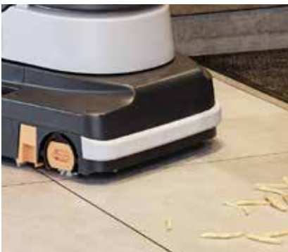
Leichtes Aufnehmen von Grobschmutz, da sich der vordere Saugfuß anheben lässt