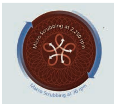
Tiefenwirkung: Rotierende und oszillierende Bewegungen für höchste Reinigungsergebnisse.