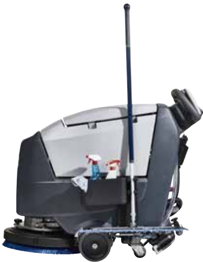
Optionaler Zubehörkorb und Halterung für den Wischmop erhältlich.