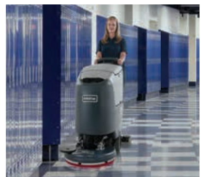
REV: Bessere Ergebnisse, höhere Produktivität und nachhaltige Reinigung.