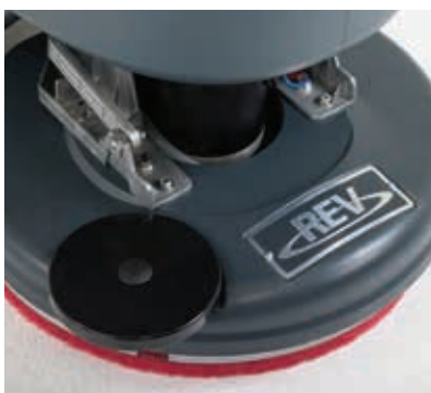
Der vollintegrierte Treibteller ist im Lieferumfang enthalten.